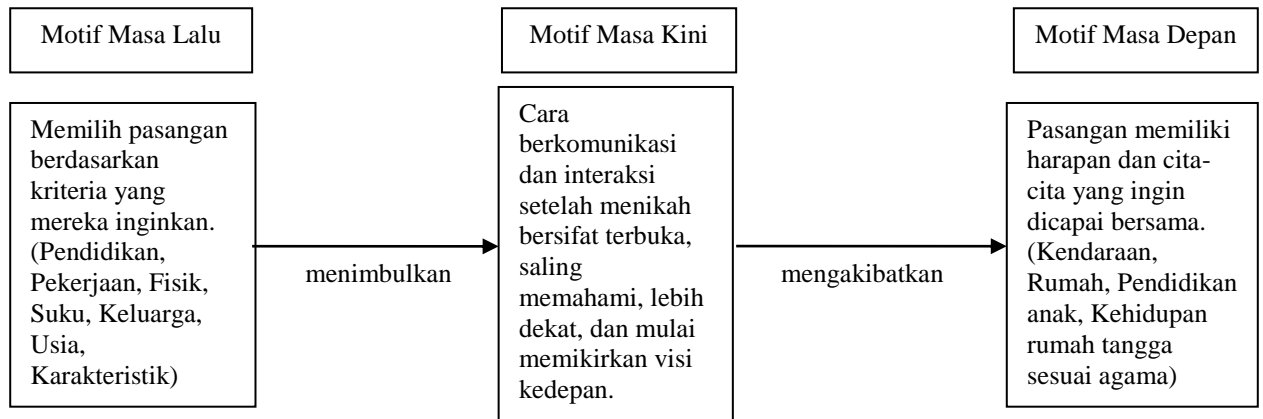
Gambar 3. Model Motif Pasangan Taaruf Online

pasangan taaruf online . Model tersebut hubungan antara motif masa lalu, motif masa kini, dan motif masa depan, seperti terlihat pada Gambar 3